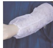
Mangote Descartável TNT