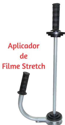
Aplicador de Filme Stretch