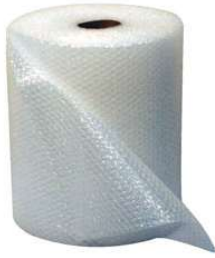
Plástico Bolha & Bolha Light