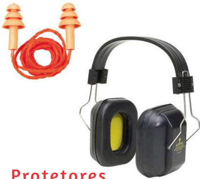
Protetores Auriculares Plug/Concha