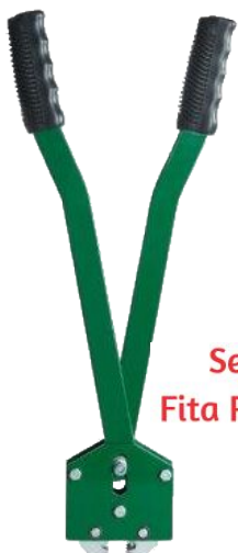
Selador para Fita Poliéster (PET)