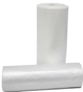
Bobina Saco Picotado