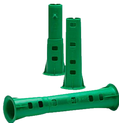
Aplicador Reutilizável de Plástico para Filme Stretch