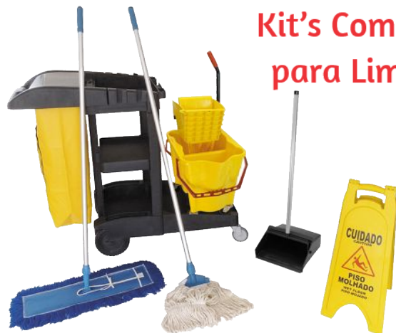
Kit's Completos para Limpeza