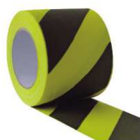
Fita Plástica Zebrada