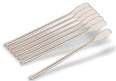
Mexedor de Café