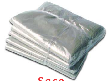
Saco Canela Reciclada