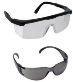
Óculos de Segurança