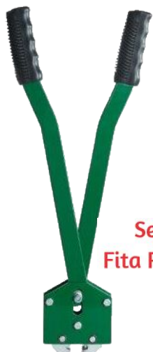
Selador para Fita Poliéster (PET)