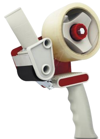
Aplicador de Fita Adesiva