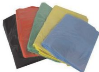
Saco para Lixo Seletivo