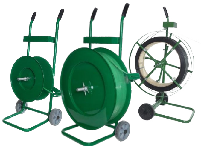
Desbobinadores de Fitas