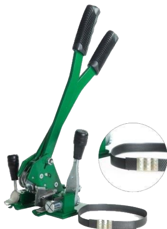
Arqueador Manual para Fita Polipropileno (PP)