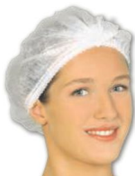
Touca Descartável TNT