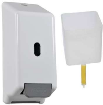
Saboneteira em ABS