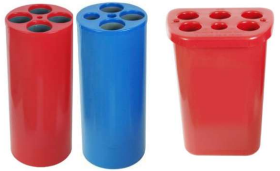
Dispensador de Copos Descartáveis