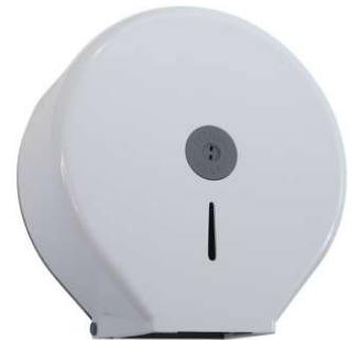
Suporte para Rolo