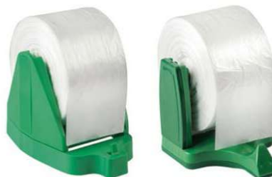
Bobina Saco Fundo Estrela