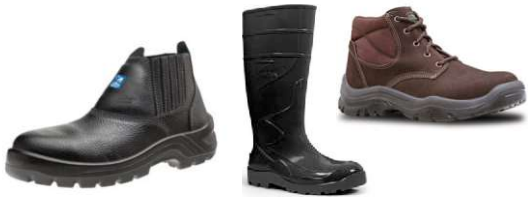
Botas & Botinas