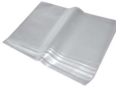
Saco Plástico PE