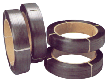
Fita de Arquear Standard Preta