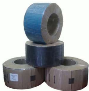
Fita de Arquear