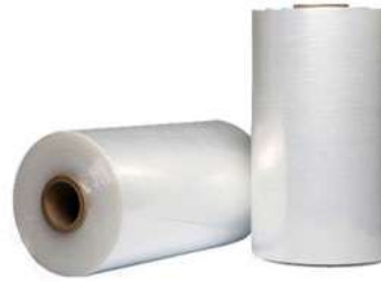
Filme Stretch Virgem & Ecológico