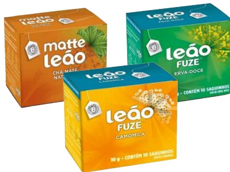
Chá em Sachê