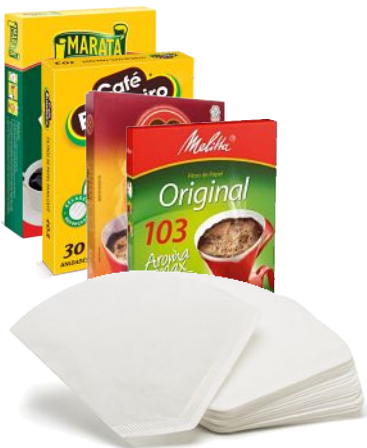
Filtro de Papel para Café