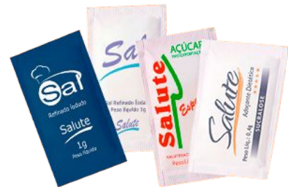
Sachês com Açúcar, Adoçante e Sal