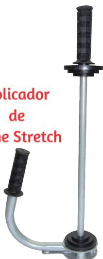
Aplicador de Filme Stretch