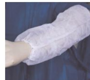
Mangote Descartável TNT