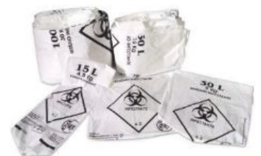
Saco para Lixo Infectante Hospitalar