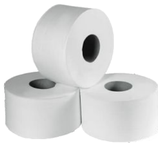
Papel Higiênico Institucional