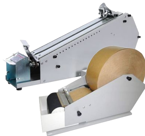
Dispensadores de Fita Çomada Canoa & Tobogã