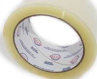
Fitas Adesivas Acrílica & Hotmelt