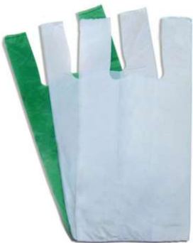
Sacola Plástica Comum (Diversas Cores & Tamanhos)