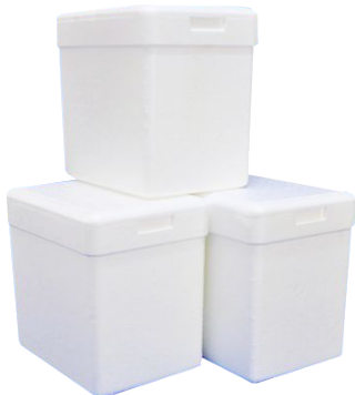
Caixas de Isopor