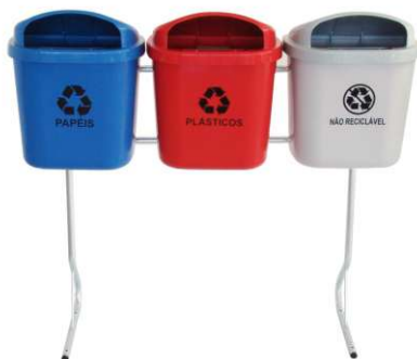
Conjunto Coleta Seletiva com Cestos