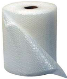
Plástico Bolha & Bolha Light