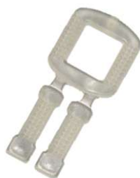
Fivela Plástica para Fita de Arquear