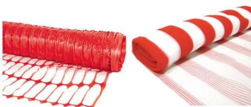
Tela Tapume Cerquite/Tecida