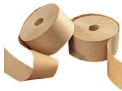
Fita Gomada Lisa Com Reforço & Sem Reforço