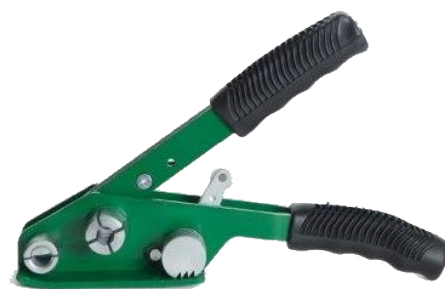
Esticador para Fita Poliéster (PET)