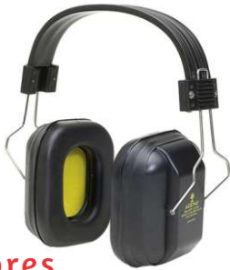
Protetores Auriculares Plug/Concha