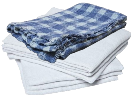
Saco Alvejado Branco & Xadrez