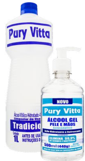
Álcool Líquido & Gel