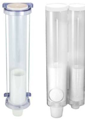
Dispenser para Copos Descartáveis