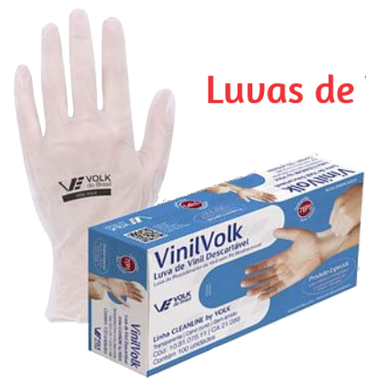
Luvas de Vinil