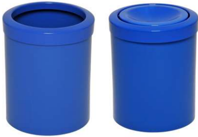
Cesto Plástico para Lixo