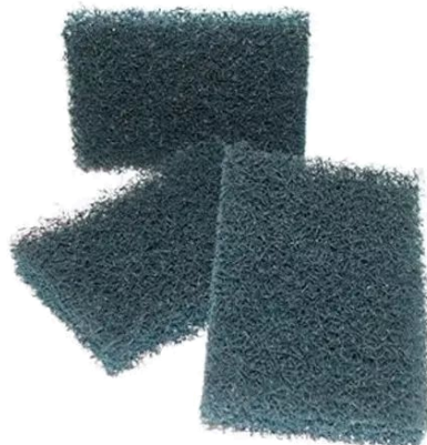
Fibraço & Esponja de Aço