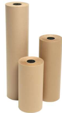
Papel Kraft & Papel Semi-Kraft