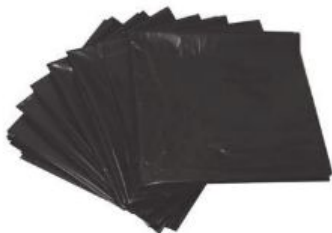
Saco para Lixo Comum (com 100 unid)